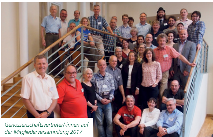
Genossenschaftsvertreter/-innen auf der Mitgliederversammlung 2017

Seit der Gründung unserer Energiegenossenschaft 1999 haben wir ökologisch sinnvolle Zukunftstechnologien konsequent weiterentwickelt. Mit den Herausforderungen unserer Zeit sind wir gewachsen, doch unsere Prinzipien sind die gleichen geblieben: Wir denken und handeln grün, vertreten politisch klar unseren Standpunkt – und sind, wenn's sein muss, auch mal unbequem.